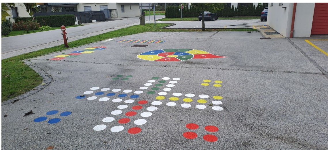
Talni poligon pri Podružnični osnovni šoli Mošnje

Talni poligon pri Podružnični osnovni šoli Mošnje so izdelali učitelji skupaj s starši in učenci. Sredstva v višini 1.000 EUR je šola porabila za nakup materiala za risanje talnih poligonov.