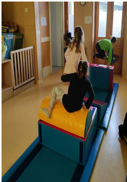
Polivalentne blazine v Vrtcu Begunje